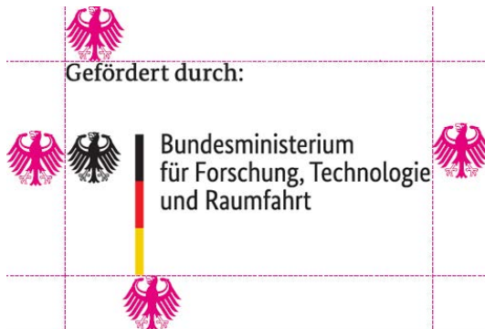
Konstruktion des Förderlogos

Alle Publikationen, bei denen das BMFTR nicht Herausgeber ist, sind Fremdpublikationen. Fremdpublikationen erscheinen nicht im CD des BMFTR.